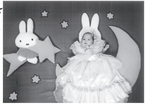
執筆 幸奈ちゃんです お悩み解決