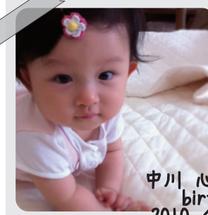
中川心花ちゃん birthday 2010/12/21