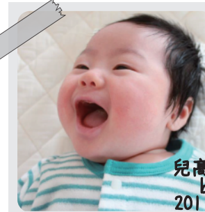
児高蒼大くん birthday 2011/7/31