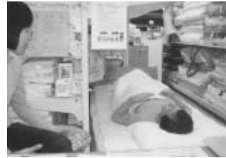
枕合わせ中のお客さま

上向き寝のくせがつくと眠りがぐんぐんと深くなります♡ カネイでは首のうしろの頸椎のカーブを計ってから上向き寝と横向き寝の両方の高さも合わせます。その日にお持ち帰り出来ます。再度微調整は無料です。