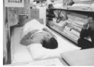
枕合わせ中のお客さま

まずは自分の体型や体格にあった枕を作り、上向きに寝られるようにしましょう。上向きに眠れない人でも、枕と敷布団を合わせば上向きに眠れるようになりますよ♡ 丸くはた、横向きばかりやうつぶせ寝を続けていると呼吸も浅くなるし、首や腰に負担がかかっています。